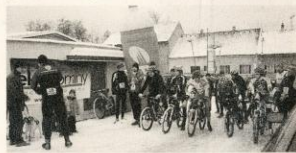
ZMRZLÝ START. V Rokycanech už po třinácté vítali cyklisté a běžci nový rok závody na vrch Žďár.

VC Eko komíny, výsledky cyklisté: 1. Cink (Merida) 14:52 min., 2. Pešek (Scott) 15:30, 3. Hlaváč 16:55, ... 10. Hranaiová (1. žena) 23:29 (oba AC Sparta). Běci, muži: 1. Minařík (Falcon Rokycany) 19:32, 2. Boček (Loko Beroun 20:05, 3. Korytář (Falcon Rokycany) 22:21. Ženy: 1. A. Franková (Loko Beroun) 26:09, 10. Pytlík (Rokycany) 26:21. (ks)