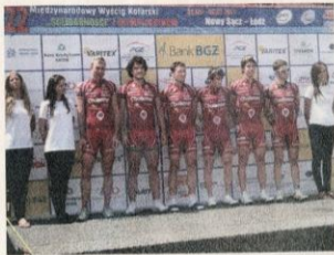
BRONZ TAKÉ PRO SPARTU. Jezdci rokycanské stáje AC Sparta se prosadili při výtečně obsazeném čtyřetapovém závodě v Polsku. Tým v červených dresech obsadil třetí místo.

výběr Polska, AC Sparta Praha skončila na 3. místě, PSK Whirlpool na místě devátém.